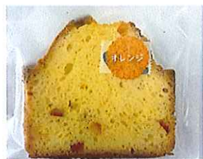
オレンジパウンド ¥110