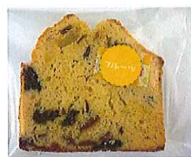
フルーツパウンド ¥110