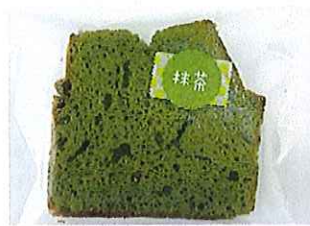
まっちゃパウンド ¥110