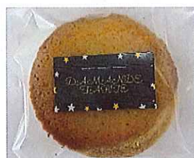
ダイヤモンドタルト ¥130